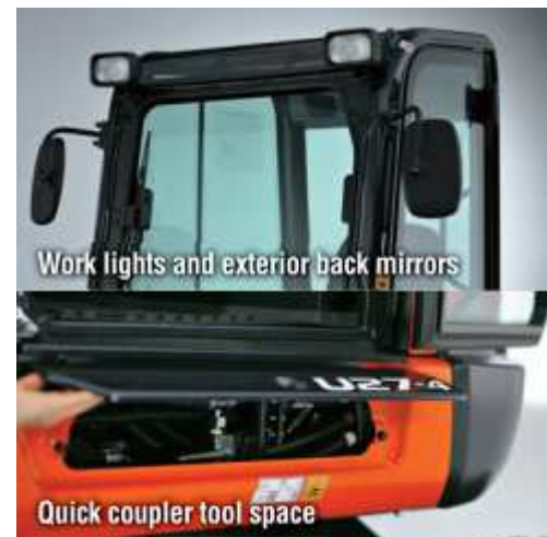
Gyorscsatlakozó kezelőszerszám tartó